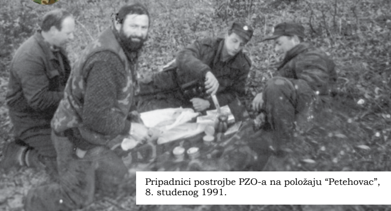
Pripadnici postrojbe PZO-a na položaju "Petehovac", 8. studenog 1991.

Tijekom 1991. godine, područje Petehovca i Zalesine bilo je glavno goransko središte, u kojem su se kroz zborišta, prostora za obuku, ustrojavanja i zapovjedna mjesta pojedinih postrojbi (3. bojna 111. brigade ZNG-a, 138. brigada HV-a, dragovoljački odredi, PP Delnice, ATJ Lučko i TO) razvijale i pokretale aktivnosti u kojima su se stanovnici Gorskog kotara u iznimno velikom broju odazvali obrani domovine. U objektu Šumarskog fakulteta Zagreb – Zalesina, 1991. godine, bilo je smješteno zapovjedništvo 138. brigade. Objekt je te godine i raketiran. S položaja Delnice – Petehovac PZO brigade srušio je prvi neprijateljski zrakoplov.