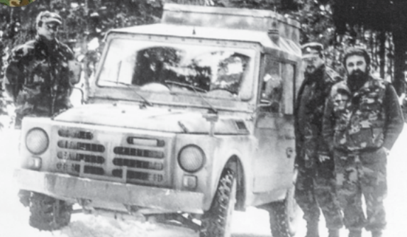
U ophodnji prostora Lokanda, prosinac 1991.

U jesen 1991. godine postrojba ravnogorske satnije (1. bojna) imala je zadaću ophodnje i nadzor područja Lokande, kao i pravca prema Mirkovici i Jasenku, radi sprečavanja neprijateljskih snaga iz tog pravca. Postrojba je bila smještena u dvorcu Stara Sušica, gdje je svakodnevno obučavana. 1991. godine, na području Lokande, pao je prvi zrakoplov, koji je pogoden u preletu iznad Delnica, pregledavajući pogodena skladišta Velebit 1, Velebit 2 i Velebit 3 (V1, V2, V3). Tom prilikom uhićen je pilot koji je imao namjeru krenuti prema Jasenku, ali je zalutao prema Ravnjoj Gori. U prosincu 1991. godine branitelji iz Ravne Gore odlaze u Liku, gdje ostaju do jeseni 1995. godine.