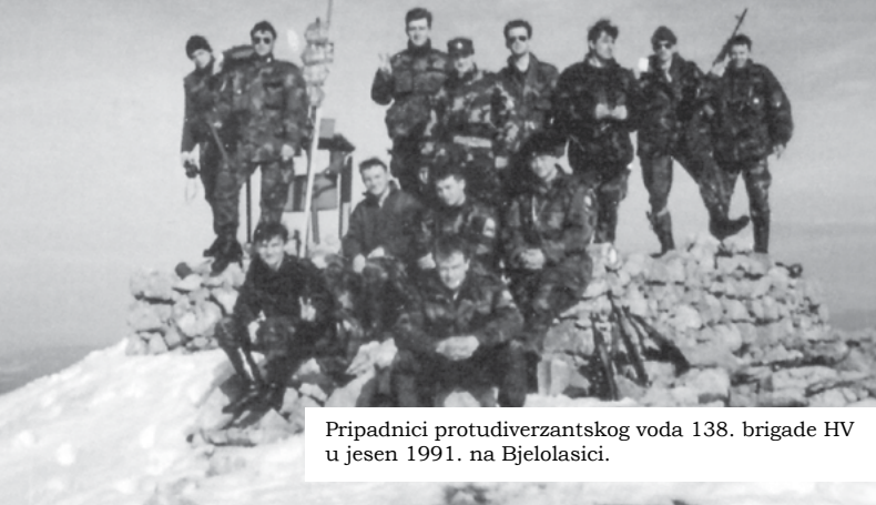
Pripadnici protudiverzantskog voda 138. brigade HV u jesen 1991. na Bjelolasici.

1991. godine kontrola područja Begovo Razdolje – Bjelolasica – Jasenak bila je zadaća pripadnika mjesnih straža Mrkoplja, a kasnije novoformirane 138. brigade HV-a (Mrkopaljska satnija). Postrojba je krajem 1991. te početkom 1992. godine smještena u Hotel Jastreb u Begovom Razdolju, sa zadaćom obučavanja ljudstva te kontrole i izviđanja navedenog područja. Pripadnici protudiverzantskog i diverzantskog voda 138. brigade HV-a, u više navrata u redovnom izviđanju bili su na području Bjelolasice.