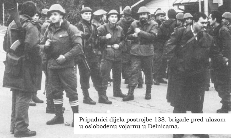
Pripadnici dijela postrojbe 138. brigade pred ulazom u oslobođenu vojarnu u Delnicama.

U podnožju planine Drgomalj nalazi se vojarna koja je do 5. studenoga 1991. godine bila u rukama bivše JNA. Brzom akcijom 5. studenoga 1991. snage PP Delnice i 138. brigade HV-a zauzele su vojarnu i ona je od tada prostor boravka 138. brigade HV-a.