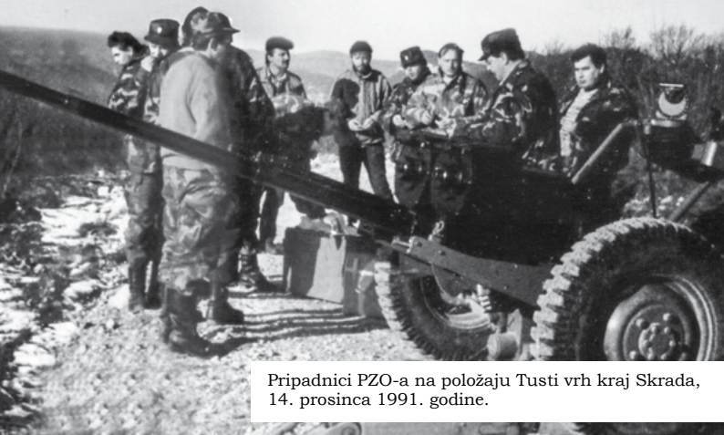
Pripadnici PZO-a na položaju Tusti vrh kraj Skrada, 14. prosinca 1991. godine.

19. prosinca 1991. godine, iz mjesta Skrad 1. bojna 138. brigade HV-a krenula je na ličku bojišnicu – Brinjski kraj. Do tog datuma bojna je bila smještena u bivšem vojnom lječilištu Skrad, podno Skradskog vrha, gdje je izvršavala obuku svojih postrojbi. U navedeni objekt prilikom raseljavanja ubojnih sredstava iz Delnica, iz skladišta V3, smještene su velike količine oružja.