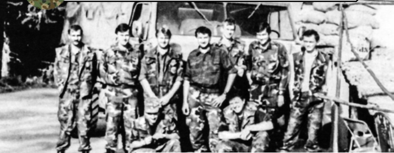
Pripadnici 1. voda 2. satnije 3. bojne na zadaći dubinskog osiguranja područja "RR", svibanj '92.

Treća bojna 138. brigade HV-a s područja Vrbovskog provodila je zadaću cestovnog osiguranja Rijeka - Zagreb (dionica Presika - Zdihovo te Vrbovsko - Ogulin i Vrbovsko - Moravice). Također su nadzirali na određenim pravcima Vrbovsko - Gormirje, Vrbovsko - Jasenak - Drežnica u slučaju potrebe neutraliziranja neprijateljskih snaga. Policijska postrojba Vrbovsko osiguravala je repetitor Mirkovicu, koji je raketiran više puta, uz ljudske žrtve. Suradnja Policijske postaje Vrbovsko i 3. bojne 138. brigade bila je svakodnevna.